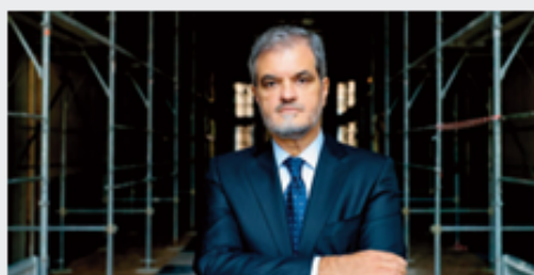
Palazzo Pamphilj, restauro della Galleria da Cortona Ambasciata del Brasile, Roma